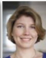
Tine Eerlingen Vlaams parlementslid