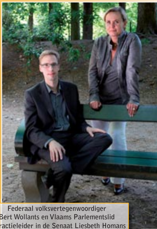
Federaal volksvertegenwoordiger Bert Wollants en Vlaams Parlementslid en fractieleider in de Senaat Liesbeth Homans zijn de N-VA-specialisten op het vlak van energie.

Uw energiefactuur swingt de pan uit. De toekomstige energiebevoorrading moet verzekerd blijven. En het is in Vlaanderen weinig realistisch om alle energie voor 100 % uit hernieuwbare bronnen te halen. Daarom ontwikkelde de N-VA een evenwichtige totaalvisie op energie.