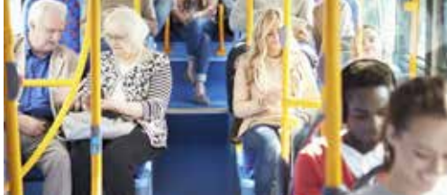
Betere busverbinding tussen Bierbeek en station p. 2