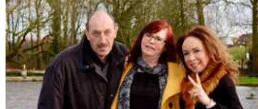
Met een nieuw bestuur naar 2018 p. 3